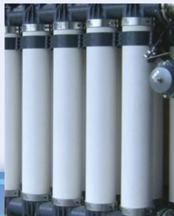
*독일 inge사 dizzer® XL UF module