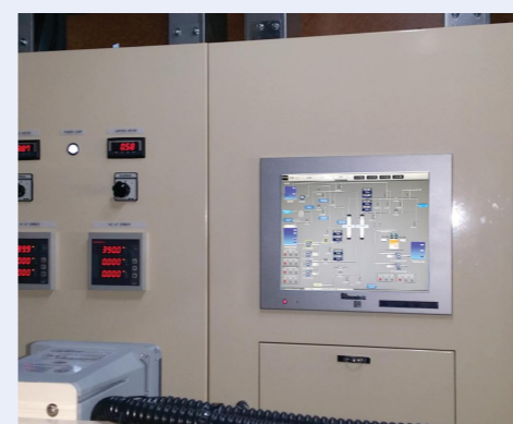
*대형 터치패널/PLC 콘트롤 적용 *펌프 인버터 적용