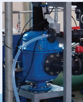
*스페인 STF Filtrors사 FMA Series