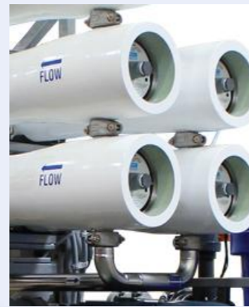
*Grundfos / Cat pumps사 펌프 적용